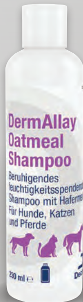
Handelsform: 230 ml Flasche