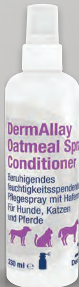
Handelsform: 230 ml Flasche