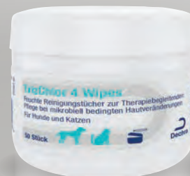
Handelsform: 50 Tücher