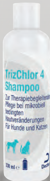
Handelsform: 230 ml Flasche