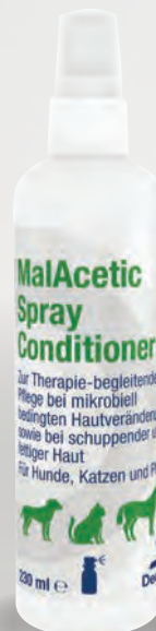
Handelsform: 230 ml Flasche