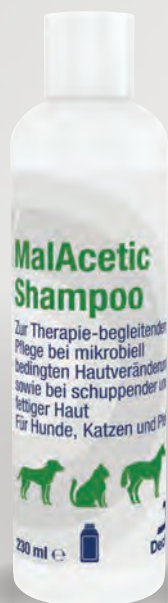
Handelsform: 230 ml Flasche