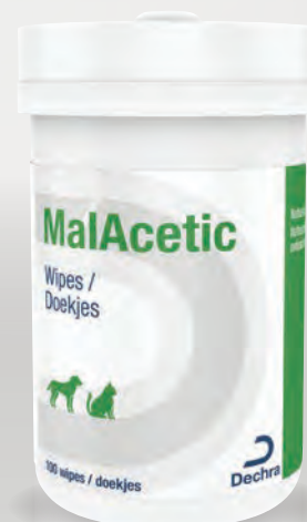
Handelsform: 100 Tücher