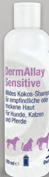
Handelsform: 230 ml Flasche