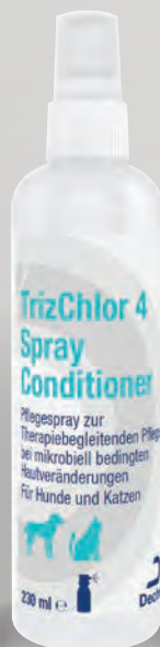
Handelsform: 230 ml Flasche