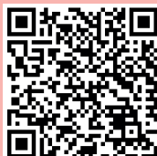
Fragebogen zum klinischen Bild

Ein enger Austausch mit Besitzerinnen und Besitzern ist wichtig, um zu verstehen wie es dem Hund mit der Vetoryl®-Therapie geht. Validierte Fragebögen zur Klinik und Lebensqualität der Cushing-Patienten unterstützen Sie in der Kommunikation.