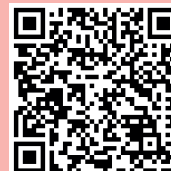
Fragebogen zur Lebensqualität